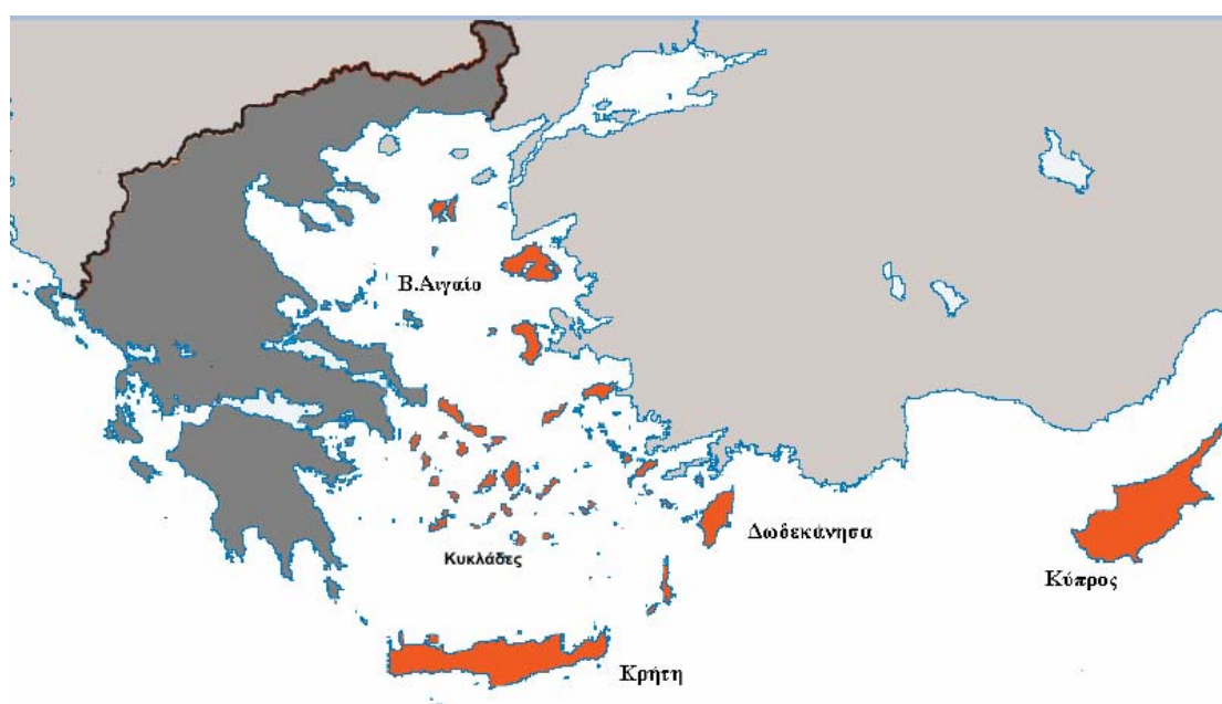
Πίνακας 1: Επιλέξιμες περιφέρειες στο πλαίσιο του προγράμματος συνεργασίας INTERREG V-A ΕΛΛΑΔΑ-ΚΥΠΡΟΣ 2014-2020

Η περιοχή του Προγράμματος, βρίσκεται σε πλεονεκτική γεωγραφική θέση στο χώρο της Νοτιοανατολικής Μεσογείου, καθώς συνδέει την περιοχή της Ευρώπης με τη Μέση Ανατολή και τη Βόρεια Αφρική, ενώ αποτελεί την πύλη εισόδου-εξόδου της ΕΕ σε τρίτες χώρες. Επίσης, κατέχει ιδιαίτερα σημαντική θέση, όσον αφορά την ανάπτυξη των σχέσεων της Ευρωπαϊκής Ένωσης με τα υπόλοιπα κράτη της Μεσογείου στο πλαίσιο της Ευρω-Μεσογειακής συνεργασίας και κομβική θέση στο πλαίσιο της ανάπτυξης της «θαλάσσιας λεωφόρου» της Νότιο-Ανατολικής Ευρώπης.