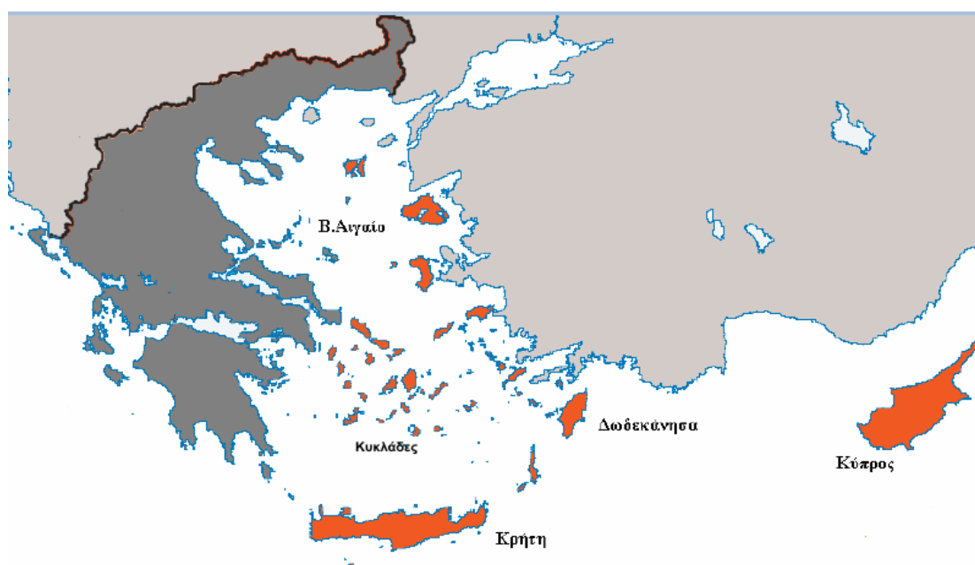
Πίνακας 1: Επιλέξιμες περιφέρειες στο πλαίσιο του προγράμματος συνεργασίας INTERREG V-A ΕΛΛΑΔΑ-ΚΥΠΡΟΣ 2014-2020

Η περιοχή του Προγράμματος, βρίσκεται σε πλεονεκτική γεωγραφική θέση στο χώρο της Νοτιοανατολικής Μεσογείου, καθώς συνδέει την περιοχή της Ευρώπης με τη Μέση Ανατολή και τη Βόρεια Αφρική, ενώ αποτελεί την πύλη εισόδου-εξόδου της ΕΕ σε τρίτες χώρες. Επίσης, κατέχει ιδιαίτερα σημαντική θέση, όσον αφορά την ανάπτυξη των σχέσεων της Ευρωπαϊκής Ένωσης με τα υπόλοιπα κράτη της Μεσογείου στο πλαίσιο της Ευρω-Μεσογειακής συνεργασίας και κομβική θέση στο πλαίσιο της ανάπτυξης της «θαλάσσιας λεωφόρου» της Νότιο-Ανατολικής Ευρώπης.