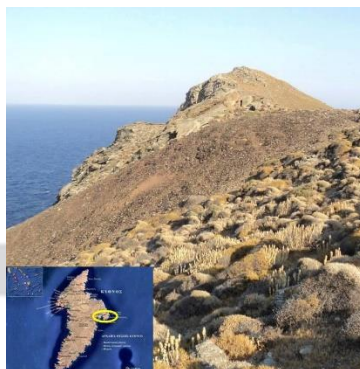
Απόθεση προϊστορικών μεταλλουργικών εκκαμινευμάτων, στη θέση «Σκουριές», Αν. Κύθνος.