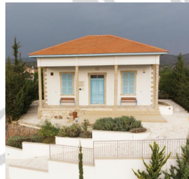
Το Παλιό Δημοτικό Σχολείο Ασγάτας, το οποίο θα διαμορφωθεί σε «Κέντρο Ανάδειξης της Φυσικής και Γεω-Μεταλλουργικής Κληρονομιάς».