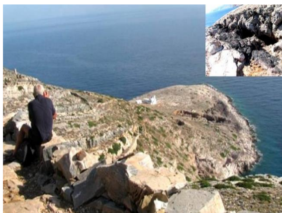
Η χερσόνησος του Αϊ Σώστη στη Σίφνο, όπου αποδείχθηκε ότι λειτουργούσε το «αρχαιότερο αργυρωρυχείο στον κόσμο».

“METAL PLACES” aims at protecting, enhancing, promoting as well as valorizing a common aspect of the cultural heritage of Greece and Cyprus, while at the same time it will contribute to the development of tourism and the enrichment of the tourist product, through cross-border cooperation and the adoption of shared “good practices” initiatives. The project adopts a multi-level approach, reconciling the different priorities set by the need for tourism development on one hand, and protection of cultural heritage of an area, on the other. The project is also directed at promoting the selected areas, using modern technologies (3D visualization, Web-GIS platform), new forms of communication (social media, mobile applications), involving also the co-participation of local stakeholders. “METAL PLACES” has a duration of 24 months and is funded by the cooperation programme Interreg V-A «Greece-Cyprus» 2014-2020, with a total of € 1,301,400.00.