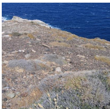
Σωροί σκωριών και «δίδυμοι» μεταλλουργικοί κλίβανοι στη θέση «Κεφάλα», Β. Σέριφος.