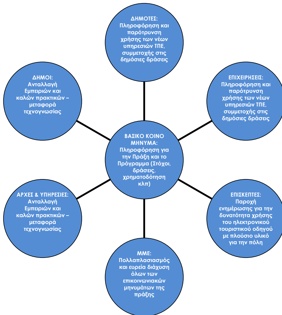
Εικόνα 1: Ομάδες - στόχοι της πράξης SmartCities

Ακολουθούν οι ομάδες – στόχοι της πράξης καθώς και το στοχευμένο μήνυμα κάθε ομάδας: