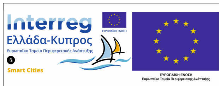
Εικόνα 2: Αυτοκόλλητο για εξοπλισμό