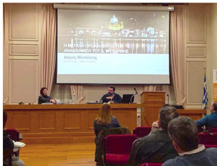
Από τις εργασίες της 3ης τεχνικής συνάντησης της πράξης «Smart Cities»

Από Νεφέλη Βαρθολομαίου - 21 Φεβρουαρίου 2020