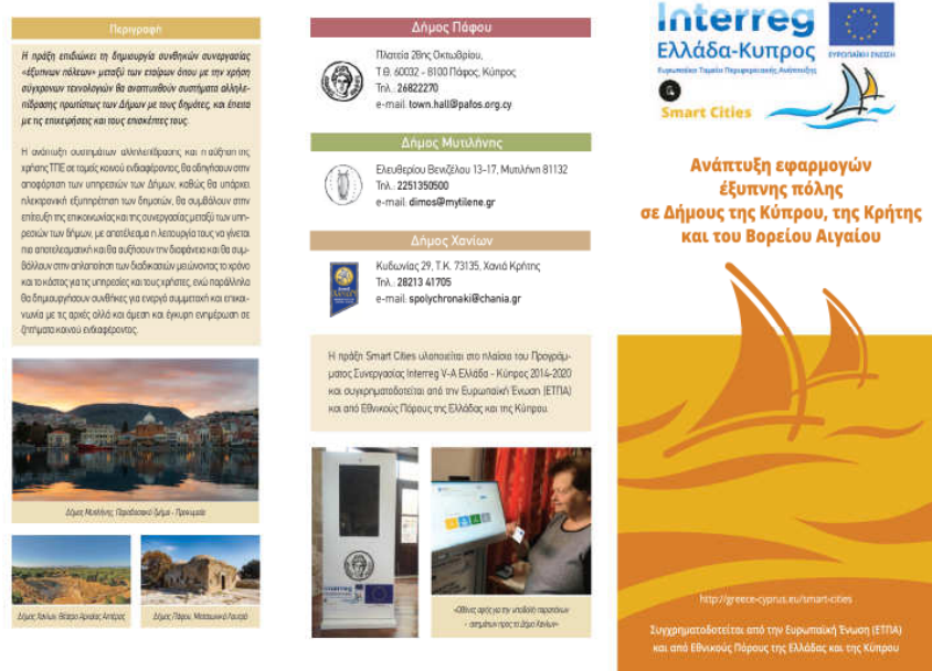
Εικόνα 4: Τρίπτυχο ενημέρωσης μέρος πρώτο