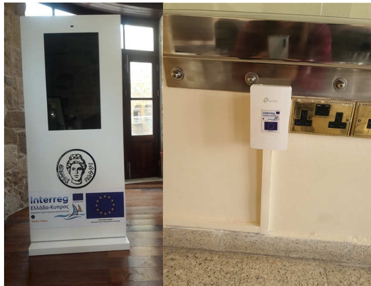
Εικόνα 3: Ανάρτηση αυτοκόλλητων στον εξοπλισμό