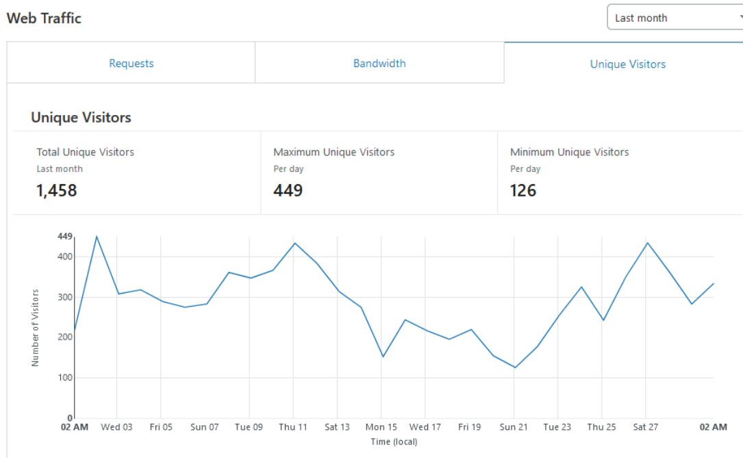
Εικόνα 8: Επισκεψιμότητα ιστοσελίδας της πράξης

Η επισκεψιμότητα της ιστοσελίδας του έργου αποδίδεται με βάση τις επισκέψεις που δέχθηκε η ιστοσελίδα από την ημέρα δημιουργία της. Παρακάτω, παρατίθεται σχετικό αποδεικτικό που έχει αποδοθεί από τον Ανάδοχο δημιουργίας της ιστοσελίδας, στο οποίο διαφαίνεται ότι ως σύνολο, επισκεψιμότητα ανέρχεται στις 1,458 επισκέψεις από χρήστες.