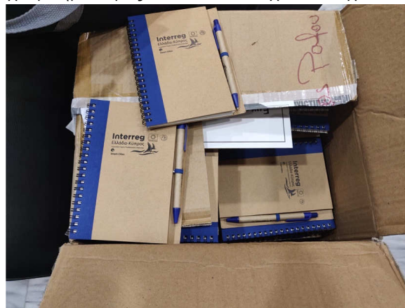
Εικόνα 6: Προωθητικό υλικό Δήμου Πάφου