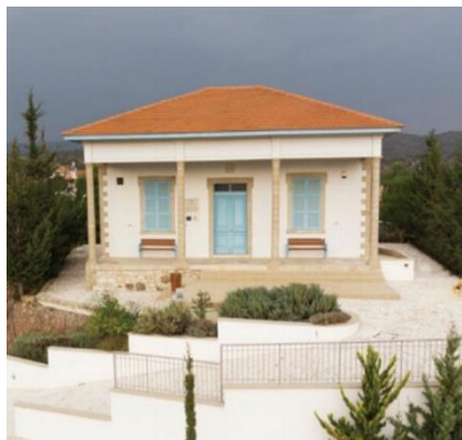
Το Παλιό Δημοτικό Σχολείο Ασγάτας, το οποίο θα διαμορφωθεί σε «Κέντρο Ανάδειξης της Φυσικής και Γεω-Μεταλλουργικής Κληρονομιάς».