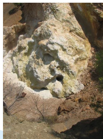
Αρχαίο μεταλλείο χαλκού στις Πλατειές Ασγάτας.